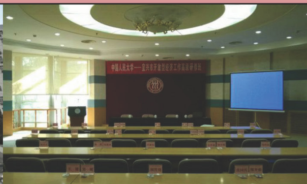
逸夫第二会议室 80-100 人