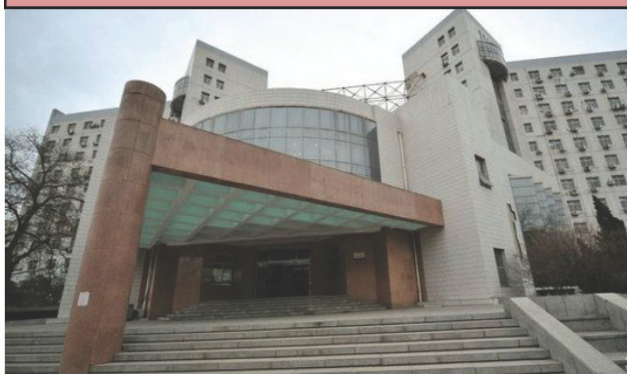
人民大学逸夫会议中心