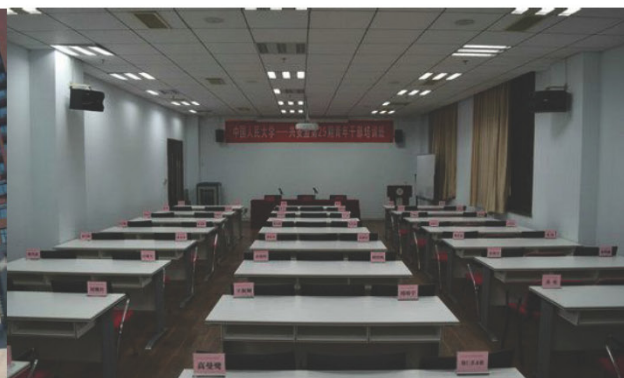
明德主楼 419 教室 50-60 人