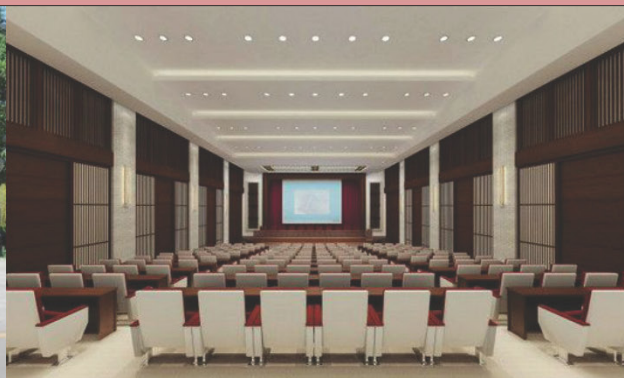
国学馆报告厅 200 人